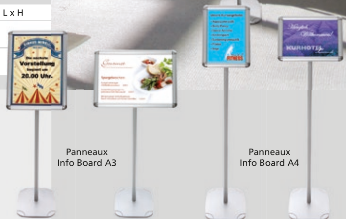
Panneaux Info Board A3